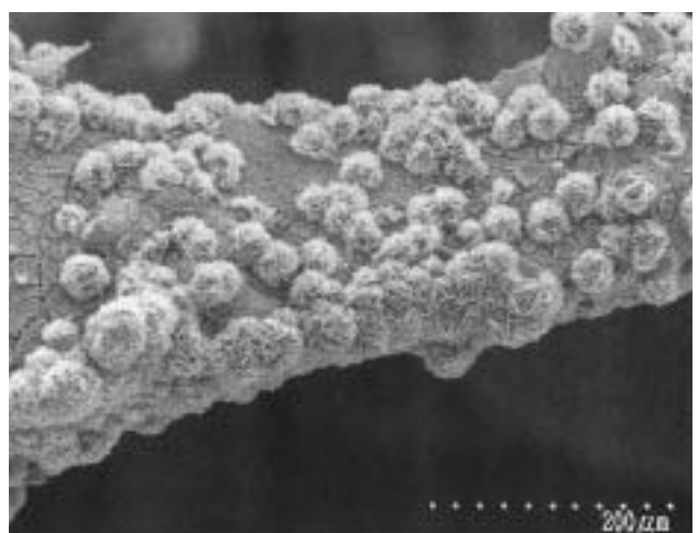
酸化チタンをコーティングした多孔質セラミックスの表面にアパタイトを生成させた試料の走査型電子顕微鏡写真（球状に見えるのがアパタイト）